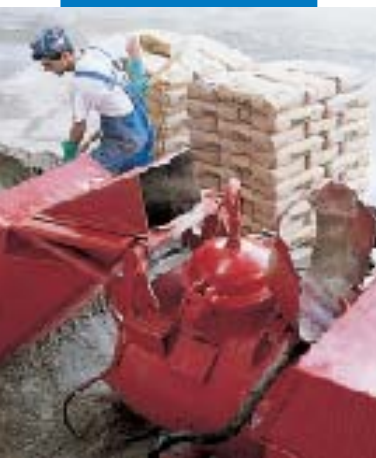
Malaxage et pompage de Topcem avec une installation automatique