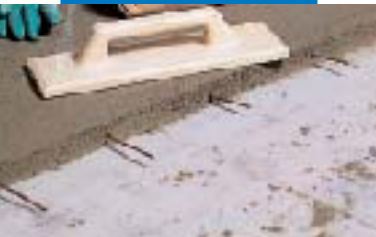
Chape Topcem avec fers de reprise