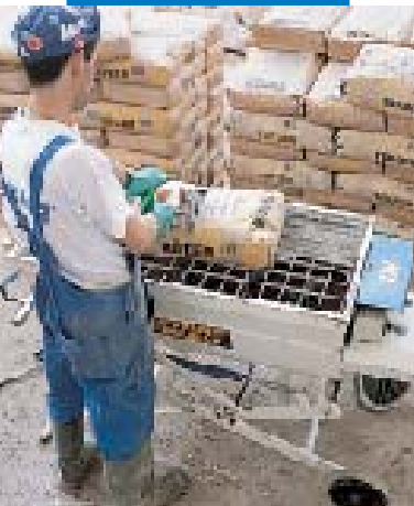
Malaxage de Topcem à l'aide d'un malaxeur horizontal