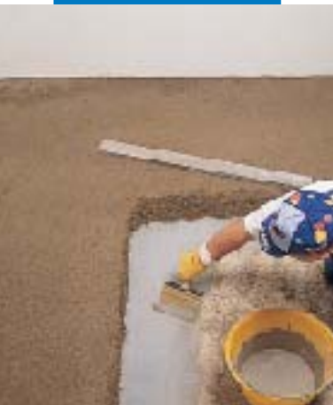
Application de la barbotine d'accrochage pour chape adhérente Topcem