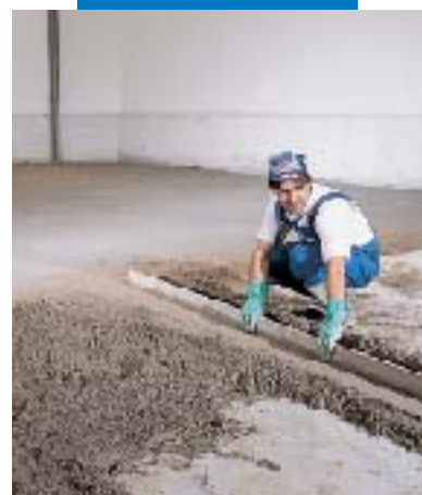
Exécution des nus de réglage