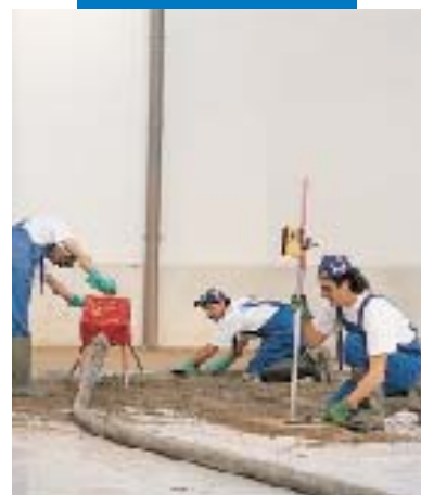
Application de Topcem