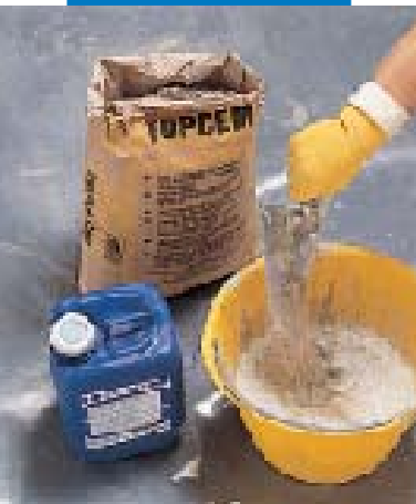
Préparation de la barbotine d'accrochage composée de Topcem et de Planicrete