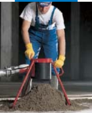
Gâchage de Topcem

nécessite d'une part, une quantité d'eau plus importante pour l'obtention d'une consistance adéquate et il ne permet pas une bonne dispersion des composants du Topcem . Si le mélange ne peut se faire autrement que manuellement (réalisation de petits travaux ou impossibilité d'utiliser mélangeur mécanique) il est conseillé de mélanger à sec et en plusieurs fois Topcem avec les charges avant d'ajouter l'eau progressivement jusqu'à obtention de la consistance souhaitée.